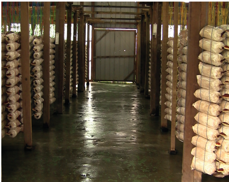
Ganoderma-ültetvény Fotó © Vatai Attila, 2009. A jogtulajdonos engedélyével.

Vírusok közül különösen a HIV-re és az EBV-re gyakorolt antivirális hatást tanulmányozták. A kivonatok in vitro körülmények között jelentősen gátolták a HIV (az AIDS, azaz Acquired Immune Deficiency Syndrome = szerzett immunhiányos tünetegyüttes kialakulásáért felelős vírus), továbbá a legtöbbször karcinogenezissel