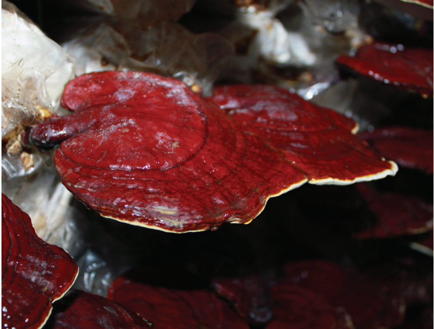
termesztett Ganoderma lucidum

A termőtestből, micéliumból és spórából eddig mintegy 400 bioaktív vegyületet mutattak ki, főleg triterpenoidokat, poliszacharidokat, nukleotidokat, szteroidokat, zsírsavakat, proteineket (peptideket) és nyomelemeket.