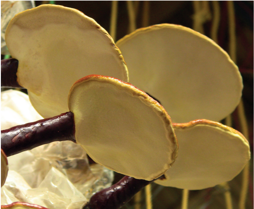
termesztett Ganoderma lucidum

Legtöbb tapasztalatot a Helicobacter pylori által okozott