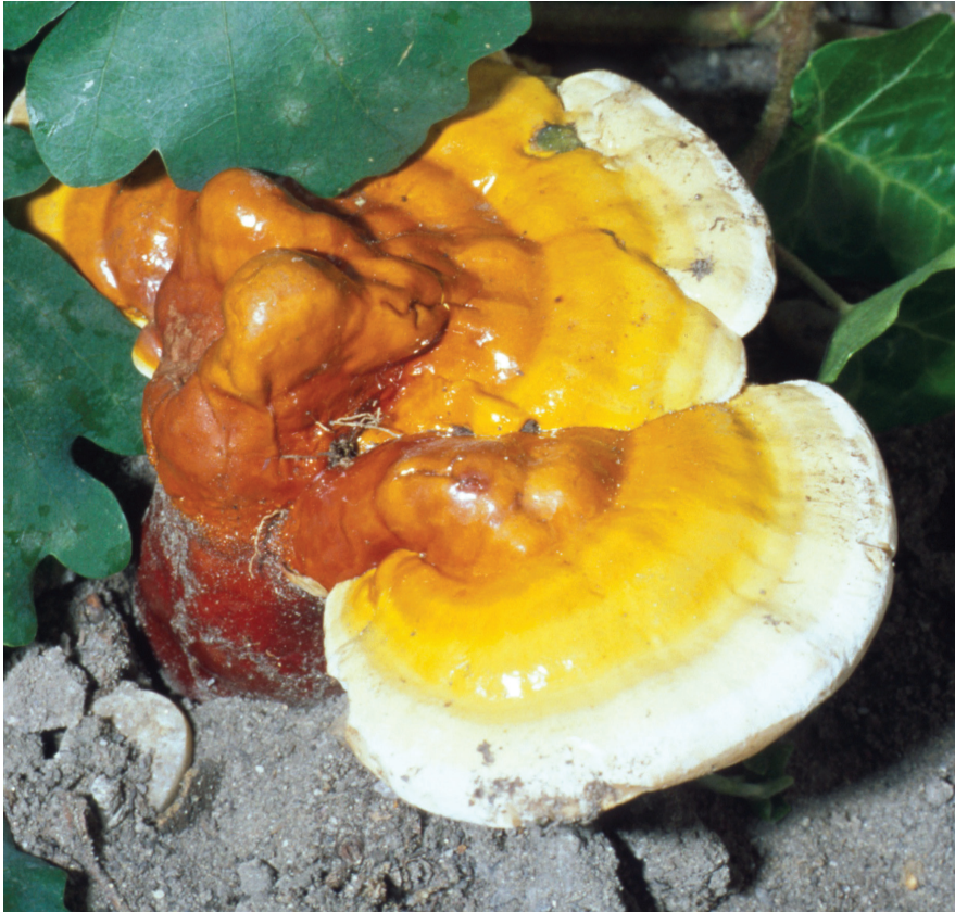
Ganoderma lucidum

Morfindependens (függő) egerekben a G. lucidum ból származó poliszacharid-peptid kezelés hatására normalizálódott az immunológiai állapot, ami kezelés nélkül nem következett be. A kísérletben a morfinnal kezelt egerek lépsejtjeiben a mRNS-expresszáció (hírvivő ribonukleinsav kifejeződése, ami a speciális fehérjék szintézisét biztosítja) jelentősen csökken. A hatást az említett kezelés ellensúlyozta, azaz a gének kifejeződése helyreállítható volt. Tehát úgy tűnik, hogy az opiáttal előidézett immundeficiencia, a hiányos immunválasz megszüntethető, vagyis a függőség előnyösen befolyásolható.