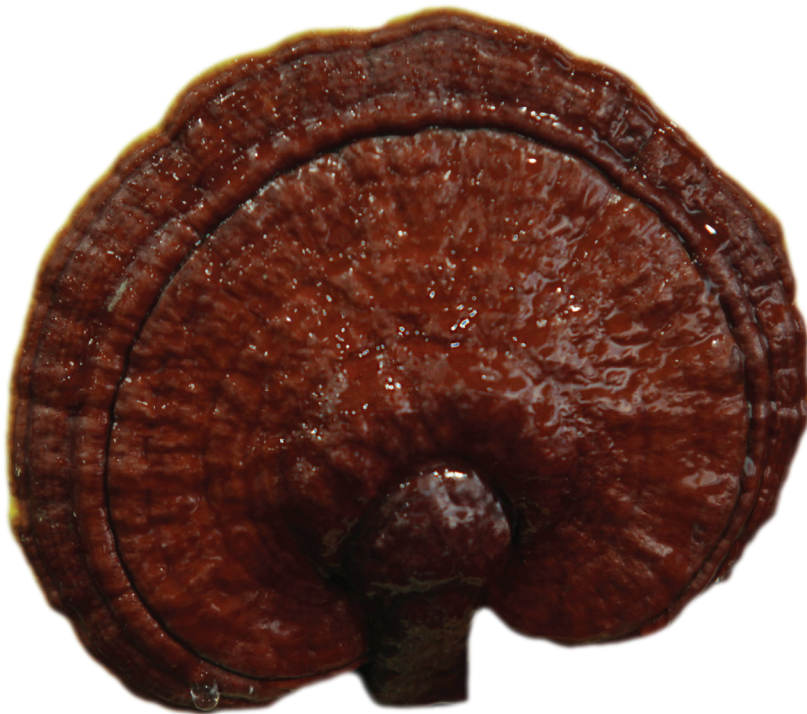
termesztett Ganoderma lucidum

Hasonlóképpen beszédes számadatokkal találkozhatunk akkor is, ha a gyógyhatású gombák gyógyításban való alkalmazhatóságát vizsgáljuk. A Földünkön élő, szabad szemmel látható, ún. nagygombák számát 140 ezerre becsülik, azonban e fajoknak csupán 10–15%-át ismerjük. Ennek ellenére legalább ezerre tehető azon gyógyhatású gombákból előállított hatóanyag-frakciók és vegyületek száma, melyeknek igen értékes terápiás hatásokat tulajdonítanak.