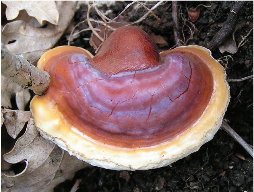
Ganoderma lucidum

A termőtestet lakkosan fénylő kéreg fedi. Eleinte bunkó alakú, majd kifejlődik a kerek, félkör vagy vese alakú, 5–25 cm átmérőjű kalapja, melynek színe sárga-vörösbarna, a közepe sötétebb, bíborbarna is, a széle pedig világosabb, fehéres-sárgásfehéres. Csövecskéi 1,5–2 cm