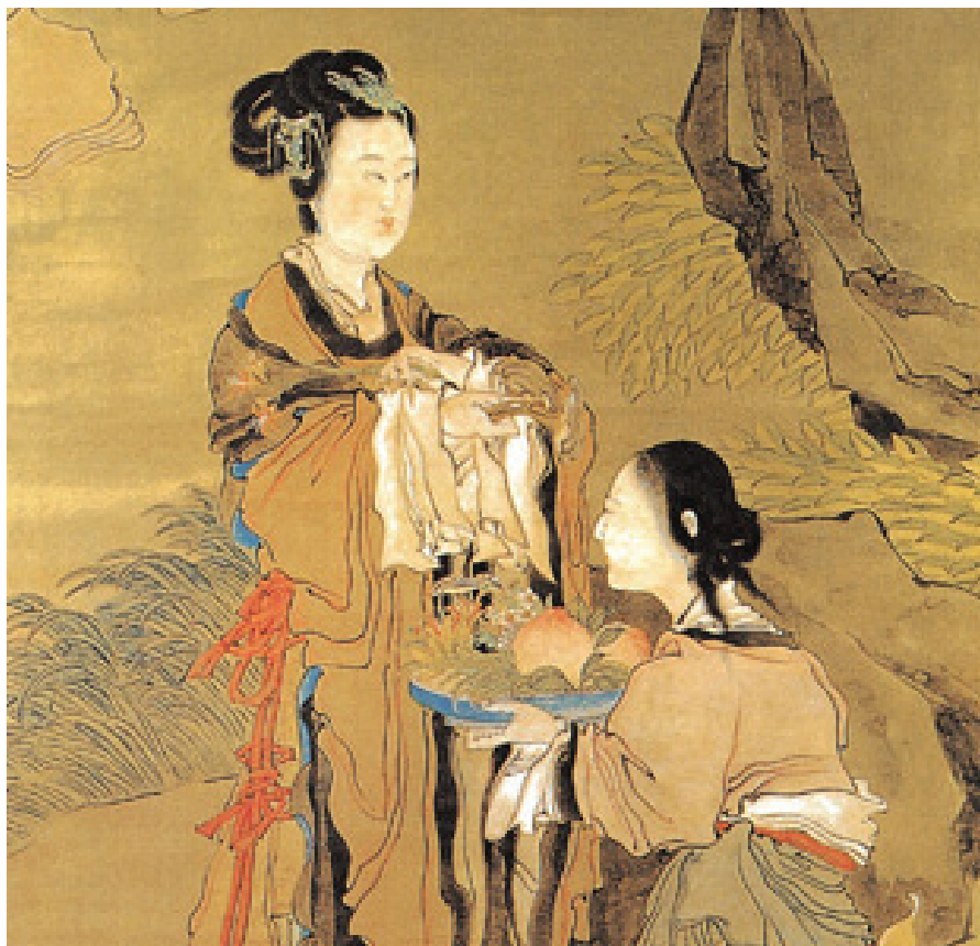
Ren Xun: Magu születésnap ajándéka [Qing-kori selyemfestmény, 麻姑獻壽圖 (清) 任薰]. Changshu város Kulturális Bizottságának gyűjteményéből.

(különösen a lucideninsav O), lucidenin-lakton (utóbbi HIV ellenesnek mutatkozott!) és más triterpenoidok. A spórák éteres frakciójából izolálták a ganosporinsav-A triterpént. A spórából több új lanosztán-típusú triterpént is elkülönítettek, ezek is különböző szerkezetű ganoderinsavak. Több adat utal arra, hogy a spóra többféle triterpénsavat tartalmaz, mint a termőtest. A változékonyság még nagyobb, ha a genotípusok és a termőhelyi adottságok sokféleségét is figyelembe vesszük. Figyelemre méltó tény, hogy a spórák különösen gazdagok triterpénekben, mivel triterpén-laktonokat is tartalmaznak. Általában megállapítható, hogy a pecsétviaszgomba triterpenoidjainak biológiai aktivitása összefügg sajátos és gyakorlati szempontból is lehetséges gyógyászati hatásukkal.