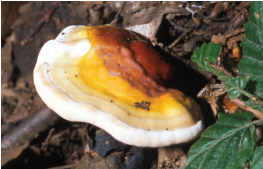
Ganoderma lucidum

ZSIGMOND GY.: Gomba és hagyomány : etnomikológiai tanulmányok. Budapest : Sepsiszentgyörgy : LKG-Pont Kiadó, 2009. 174 p. ISBN 963 8756 74 9