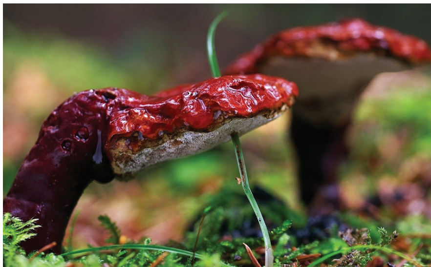
Ganoderma lucidum

Tudományos ismeretterjesztő füzetünk célja az, hogy a pecsétviaszgombáról ( Ganoderma lucidum ) fontos alapadatokat adjunk közre, illetve segítsük a természetes gyógymódok iránt érdeklődőket abban, hogy megérthessék, mit várhatnak és mit nem várhatnak el ettől az Ázsiában évezredek óta használt, majd a múlt század közepétől a nyugati tudományos élet számára is felfedezett gombától