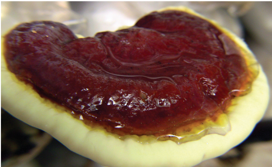
termesztett Ganoderma lucidum

A Ganoderma lucidum ból származó ergoszterolperoxid (5,8-epidioxi-5 \alpha ,8 \beta -ergosta-6,22E-dien-3 \beta -ol) szelektíven erősíti a linolsav DNS-polimeráz- \beta -ra gyakorolt gátló hatását, de e hatása nem érvényesül a DNS-polimeráz- \alpha enzimre. Az ergoszterolperoxid önmagában hatástalannak mutatkozott, de linolsav jelenlétében gátolta a DNS-polimeráz- \beta -át.