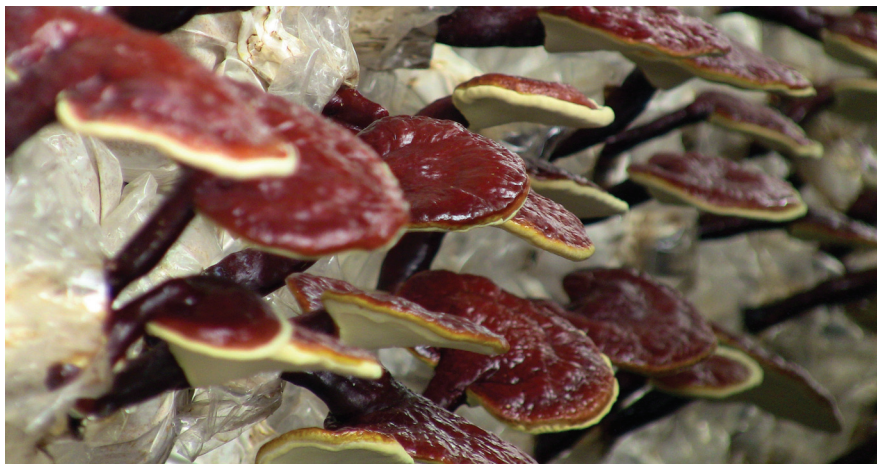
termesztett Ganoderma lucidum

Publikációk sora bizonyítja, hogy alternatív adjuvánsként használják leukémia, karcinóma, hepatitis és diabetes betegségek esetén. A legtöbb esetben azonban hiányoznak az elfogadható bizonyítékként szükséges kontroll vizsgálatok. Az utóbbi évtizedben már egyre több igényes beszámoló közlemény jelenik meg a terápiás alkalmazhatóságáról.