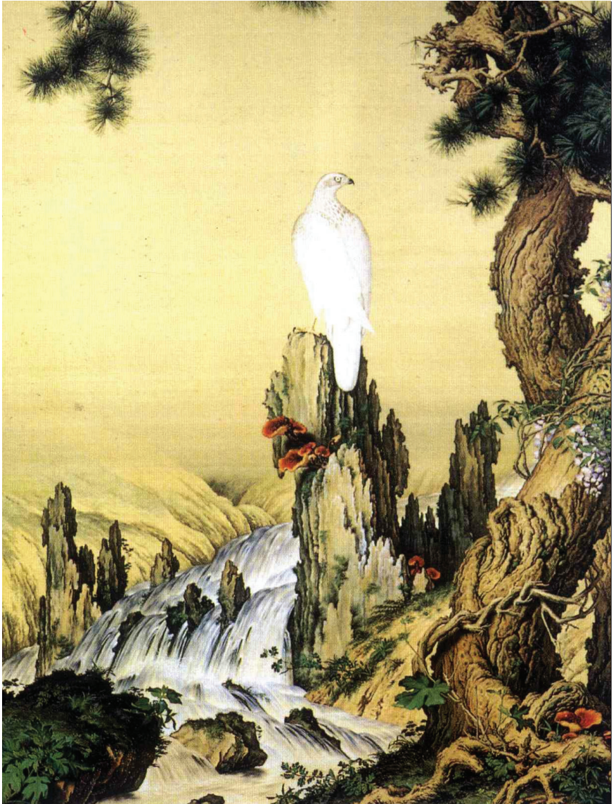
Lang Shi-zhu: A Song-hegy sólyommal és Ganodermával [Qing-kori selyemfestmény, 嵩獻英芝 (清) 郎世宁]. A Tajpej-i Palotamúzeum gyűjteményéből.

segít a leromlott egészségi állapotú betegek gyógyulásában, kiemelt jelentősége van a gyomor-, a vastagbél-, a máj- és a hasnyálmirigyrák kiegészítő kezelésében és a kemoterápia mellékhatásainak kivédésében. A nevek jelentése is a különleges hatásra utal!