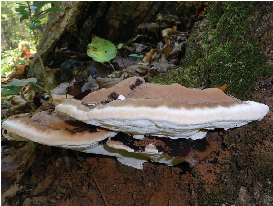
Ganoderma applanatum

A termőtest nagyméretű, többé-kevésbé félkör alakú, hosszanti átmérője 10–60 cm. Lapos, vastagsága 2–8 cm, felülete nem fényes, hanem matt, szürkésbarna, sávos-ráncos, kemény. Kérgének vastagsága 1 mm-ig terjed. Több példány egymás felett is elhelyezkedhet. A termőréteg csövecskéi rétegenként 1–2 cm hosszúak, a rétegek között sötétbarna elválasztó zóna található. A pórusok frissen fehérek,